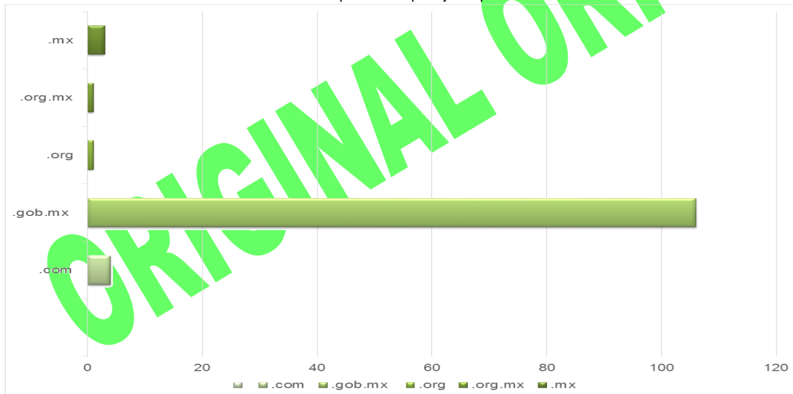
Gráfica Número 1: Tipos de hospedaje de portales evaluados

Respecto al hospedaje, se encontró que algunos municipios ocupan extensiones no oficiales, los cuales no garantizan la permanencia de las páginas web al ser propiedad de quien realizó el trámite para su habilitación, tampoco facilitan su búsqueda debido a que ponen palabras adicionales al nombre del municipio.